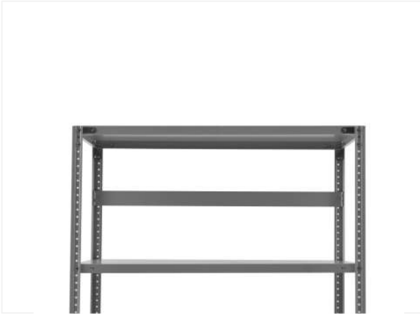
22 Устанавливаем задний делитель ПТС.