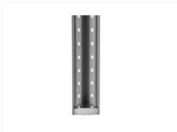
04 Вставляем (защелкиваем) подпятник в стойку.