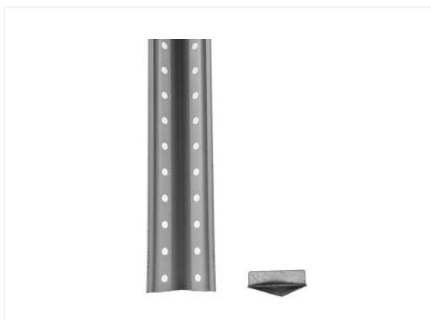
03 Берем стойку ТС и подпятник ТС.