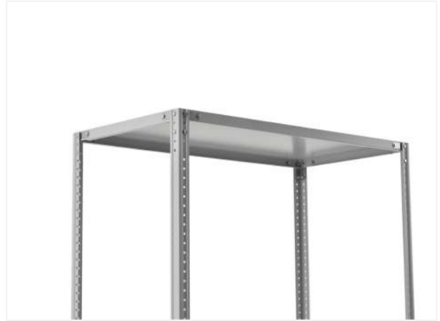
14 Вид верхней полки стеллажа.