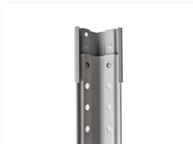
30 Устанавливаем (защелкиваем) переходник на край одной стойки (вид изнутри).