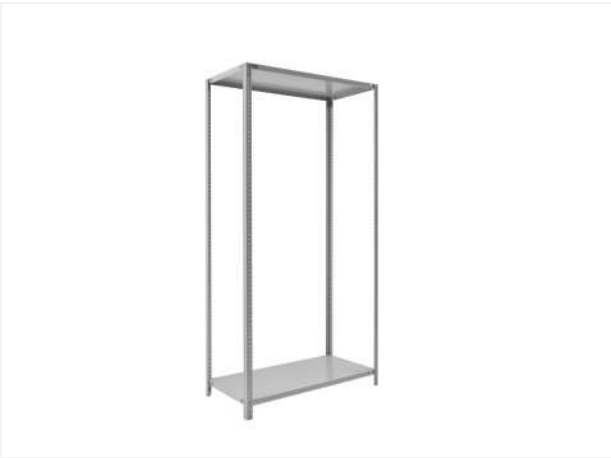
15 Получаем собранную конструкцию стеллажа ТС Лайт.