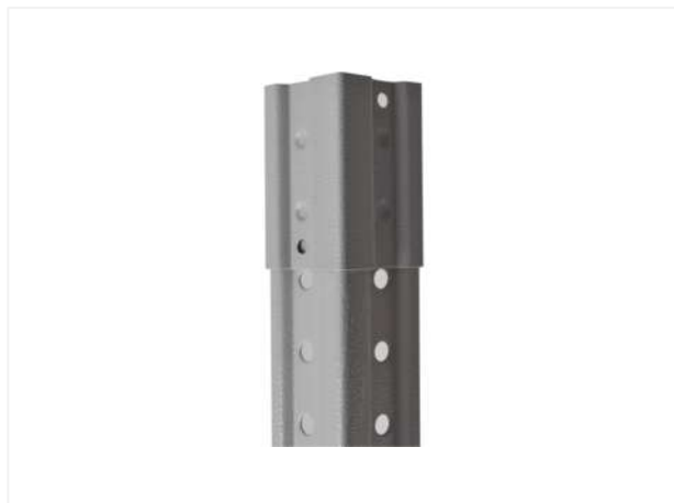
29 Устанавливаем (защелкиваем) переходник на край одной стойки (вид снаружи).