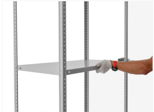
16 Устанавливаем промежуточные полки.