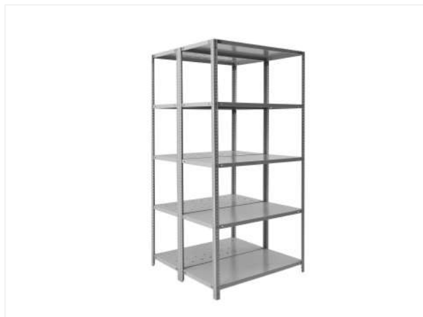
33 Возможна установка двух секций стеллажа способом спина к спине.