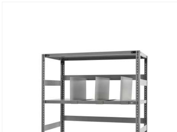
27 Аналогично устанавливаем все держатели для книг на стеллаж.