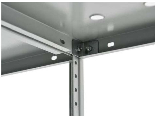
32 Схема установки усилителя полки углового ТС. Устанавливается только на полки длиной 1200 мм и при сборке в линию.