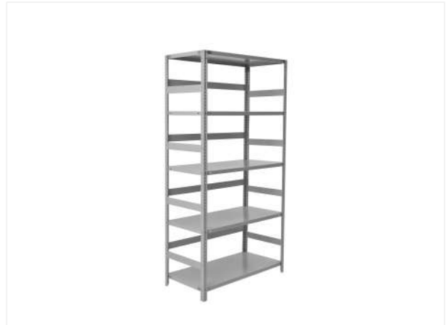
25 Аналогично устанавливаем все боковые делители на стеллаж.