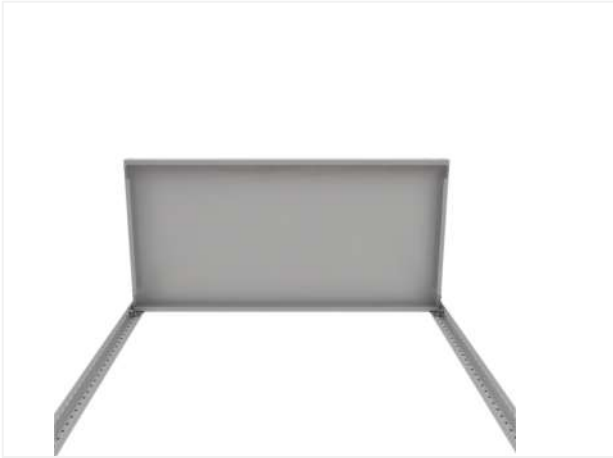
09 Теперь прикрепите верхнюю полку.