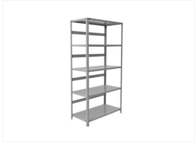
23 Аналогично устанавливаем все задние делители на стеллаж.