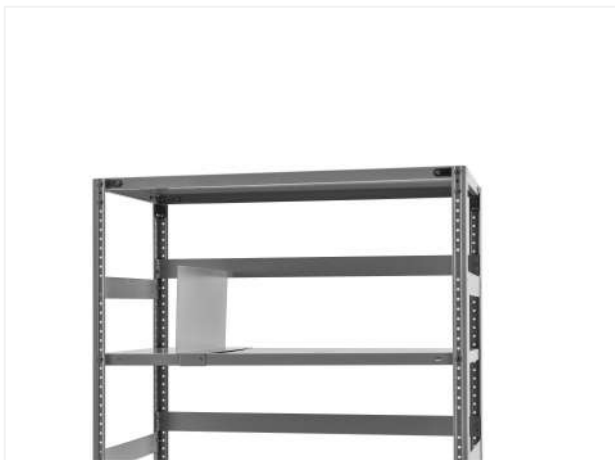
26 Устанавливаем держатель ТСУ для книг.