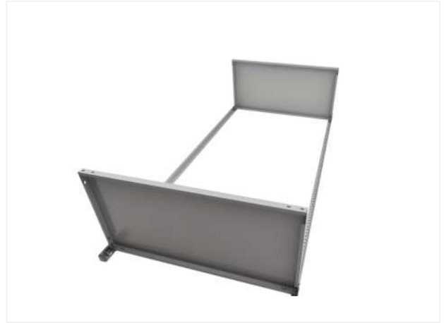
10 На данную часть конструкции стеллажа устанавливаем еще две стойки.