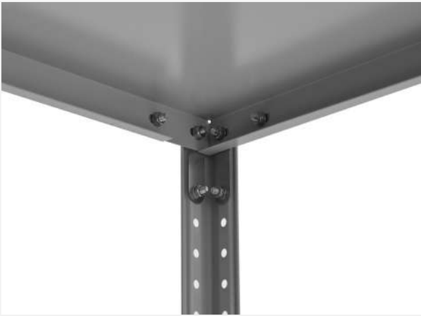
13 Внутренний вид угла верхней и нижней полки с креплением.