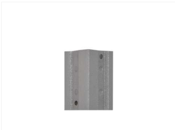
28 Берем переходник ТС.