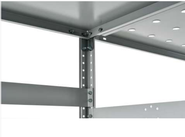
24 Устанавливаем боковой делитель ПТС.