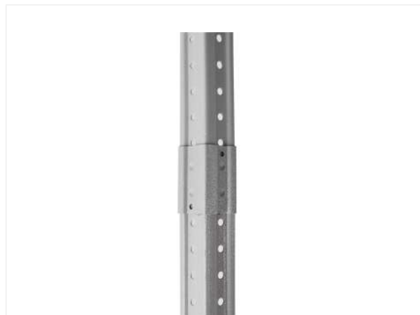
31 Вставляем край второй стойки в установленный переходник.