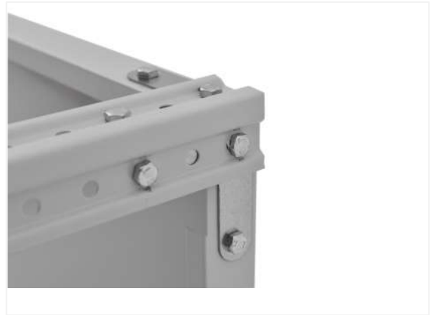
12 Внешний вид угла стеллажа с креплением.