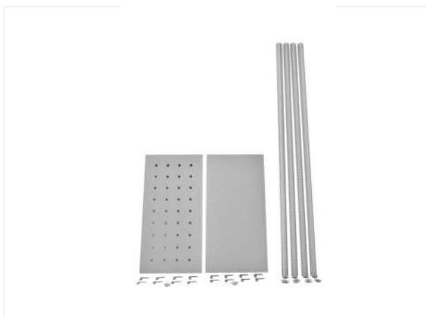
01 Общий вид комплектующих стеллажей серии ТС Лайт.