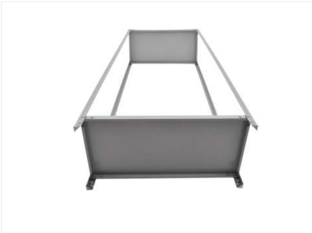
11 Закрепляем стойки.